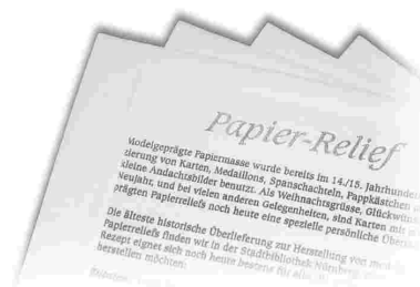
Papierpack mit 5 Blatt Baumwollpapier und 5 Blatt Zellulosepapier, Format 180x240 mm, Basis für Papiermischung um Papierreliefs selber herzustellen