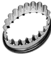
Ausstecher oval gezackt Chromnickelstahl