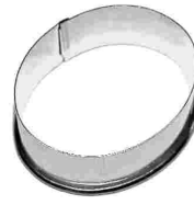
Ausstecher oval glatt Weissblech