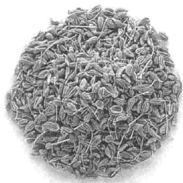
Änisgewürz 1. Qualität, gereinigt