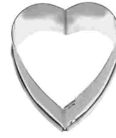
Ausstecher Herzformen Chromnickelstahl