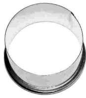
Ausstecher rund glatt Weissblech