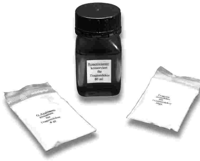
Teil-Zutaten für traditionelles Tragantdekor Tragantpulver, Gummi Arabicum, Rosenwasser