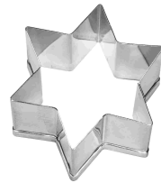
Ausstecher Stern Chromnickelstahl