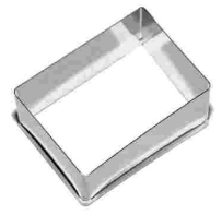
Ausstecher rechteckig Chromnickelstahl