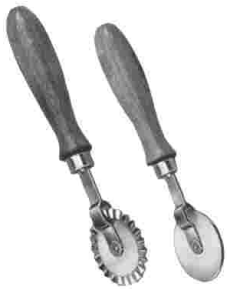
Teigrädchen mit Holzgriff, vernickelt Ø 50 mm, ganze Länge 190 mm