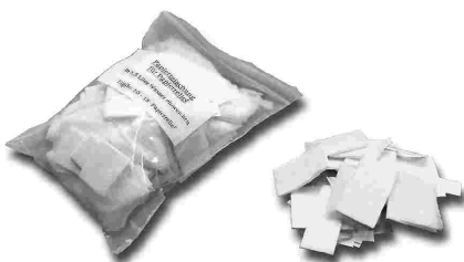
Papiermischung für Reliefkarten ergibt 10–15 Papierreliefs